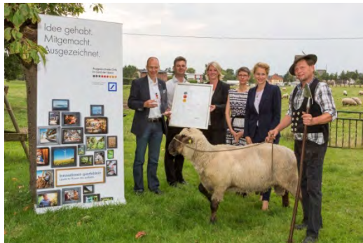
Sommerflimmern - Kino auf dem Lande, Hilter, 08.08.2014

Bitte haben Sie Verständnis dafür, dass eine finanzielle Unterstützung Ihrer Veranstaltung seitens der Wettbewerbsveranstalter nicht möglich ist.