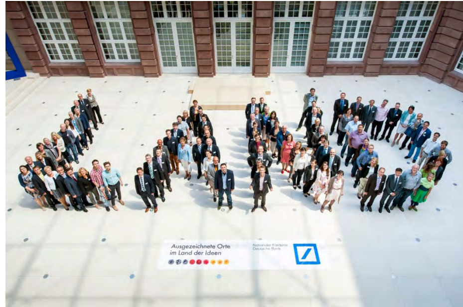
Netzwerktreffen am 03.07.2014 bei der Deutschen Bank Unter den Linden in Berlin