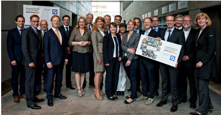
Die Expertenjury und der Fachbeirat 2014 in Berlin.