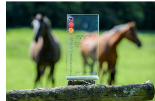
Kultur Rockt – Das Sommerfestival im Pferdestall, Dörnholthausen, 01.08.2014