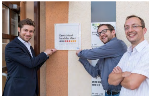
Satellitentechnik für die Landwirtschaft, Würzburg, 07.08.2014