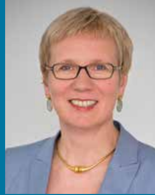
Prof. Dr. Johanna Wanka Bundesministerin für Bildung und Forschung

In der Vielfalt unterschiedlicher Hochschultypen und unterschiedlicher Profile liegt eine besondere Stärke der deutschen Hochschullandschaft. Unsere Fachhochschulen sowie die